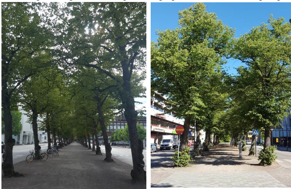
Figur 5. Genomsläpplig beläggning och Lindar på Västra Esplanaden i Växjö.

Markbeläggning och överbyggnad i mittremsan byttes ut mot mer permeabla material utformning och utförande var Tekniska förvaltningens parkavdelning. Förändring av utformningen av dagvattenhantering i befintlig väg var Tekniska förvaltningens gatuavdelning.